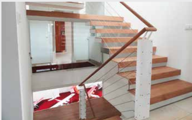
Edelstahl-Seilgeländer - Holzhandlauf Nuss geölt