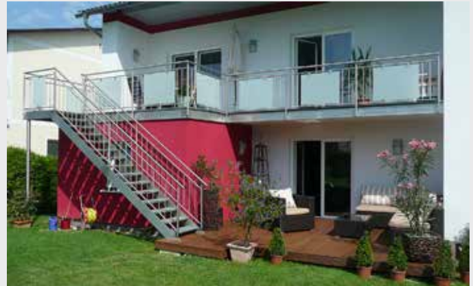
Edelstahl-Geländer Rund mit Treppe - Stab- & Glasfüllung kombiniert