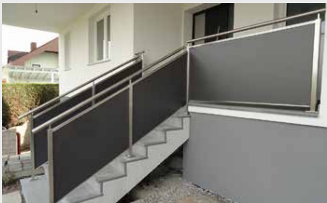
Edelstahl-Geländer Eckig - Maxx Platten als Sicht- & Witterungsschutz