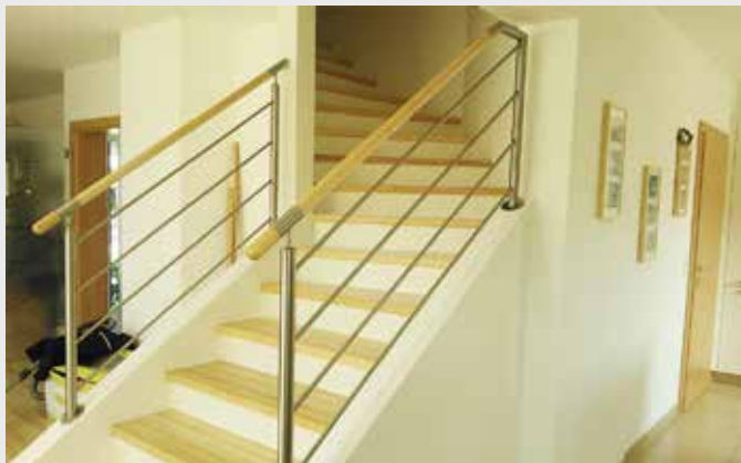
Edelstahl-Geländer Rund mit Querstäben - Holzhandlauf Ahorn gebeizt

Ob klassisch, modern oder verschnörkelt, wir können fast allen Ihren Wünschen entsprechen und dadurch ist jedes Geländer oder jede Treppe ein Unikat, ganz unverwechselbar nach Ihrem persönlichen Geschmack.