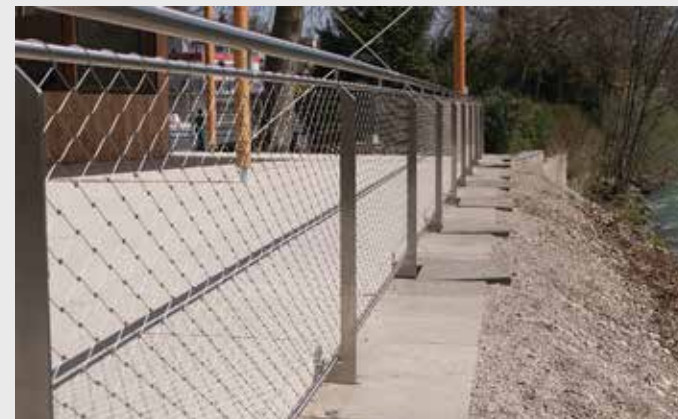
Edelstahl-Zaun - Edelstahl-Maschendraht über Schwerter gespannt