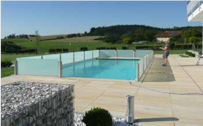
Absturzsicherung Pool - Edelstahl-Steher Rund mit Satinato Glasfüllung