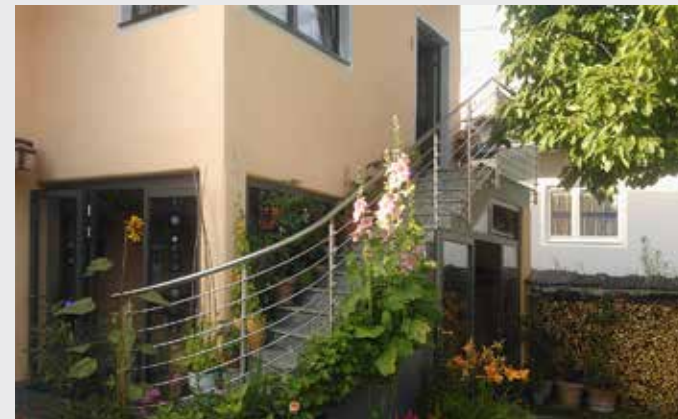
Edelstahl-Treppengeländer Rund - mit gebogenem Austritt