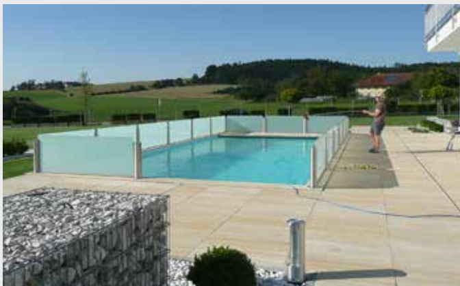
Absturzsicherung Pool - Edelstahl-Steher Rund mit Satinato Glasfüllung

Ein Edelstahl-Geländer bietet Ihnen eine lang andauernde Freude ohne großen Pflegeaufwand. Ob mit Edelstahl-Füllstäben, -Seilen oder -Maschendraht, Edelstahl macht immer eine gute Figur.