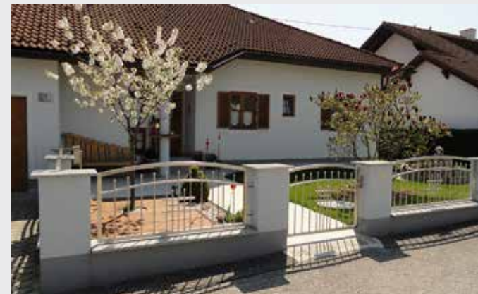
Edelstahl-Zaun Geschwungen - Eckig & Rund kombiniert mit Zierstäben

Auch die Kombinationsmöglichkeiten von Edelstahl sind nahezu unbegrenzt, ob Steinzeug, Glas, Holz oder Fassadenplatten.